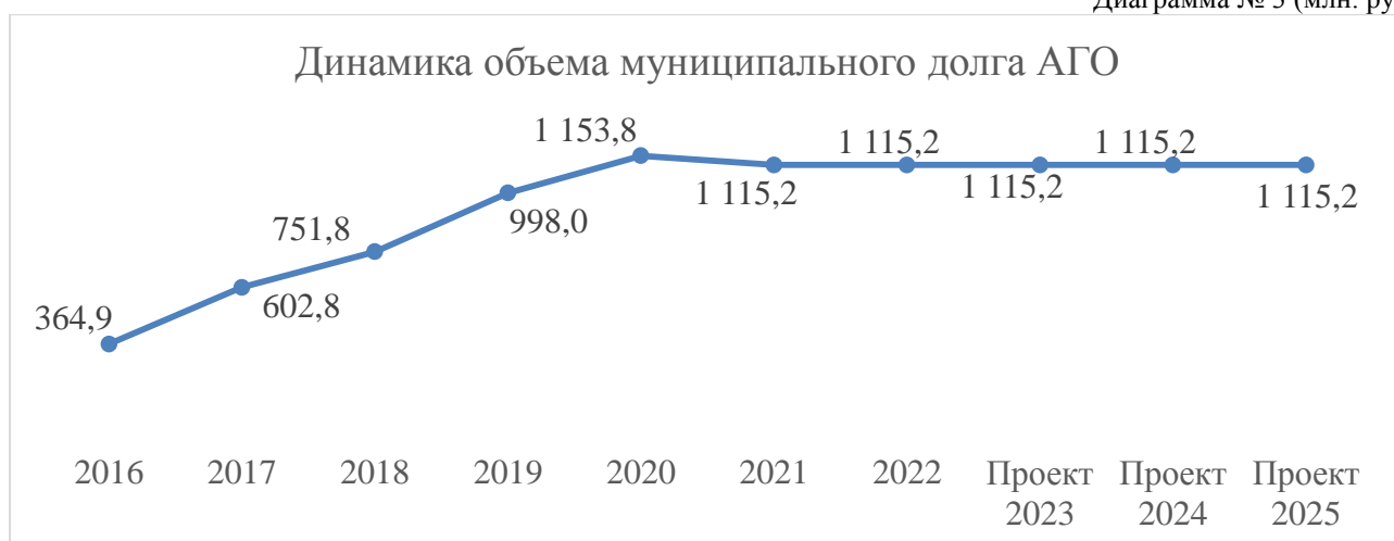
Диаграмма № 3 (млн. руб.)

Объемы расходов на обслуживание муниципального долга АГО планируются в 2023 году в сумме 1 272,5 тыс. руб. (0,03%), в 2024 году - 1 269,2 тыс. руб. (0,03%), в 2025 году - 1 243,5 тыс. руб. (0,04%), что не превышает предельную норму, установленную статьей 111 Бюджетного кодекса Российской Федерации в размере 15% объема расходов местного бюджета, за исключением объема расходов, осуществляемых за счет субвенций, предоставляемых из бюджетов бюджетной системы Российской Федерации.