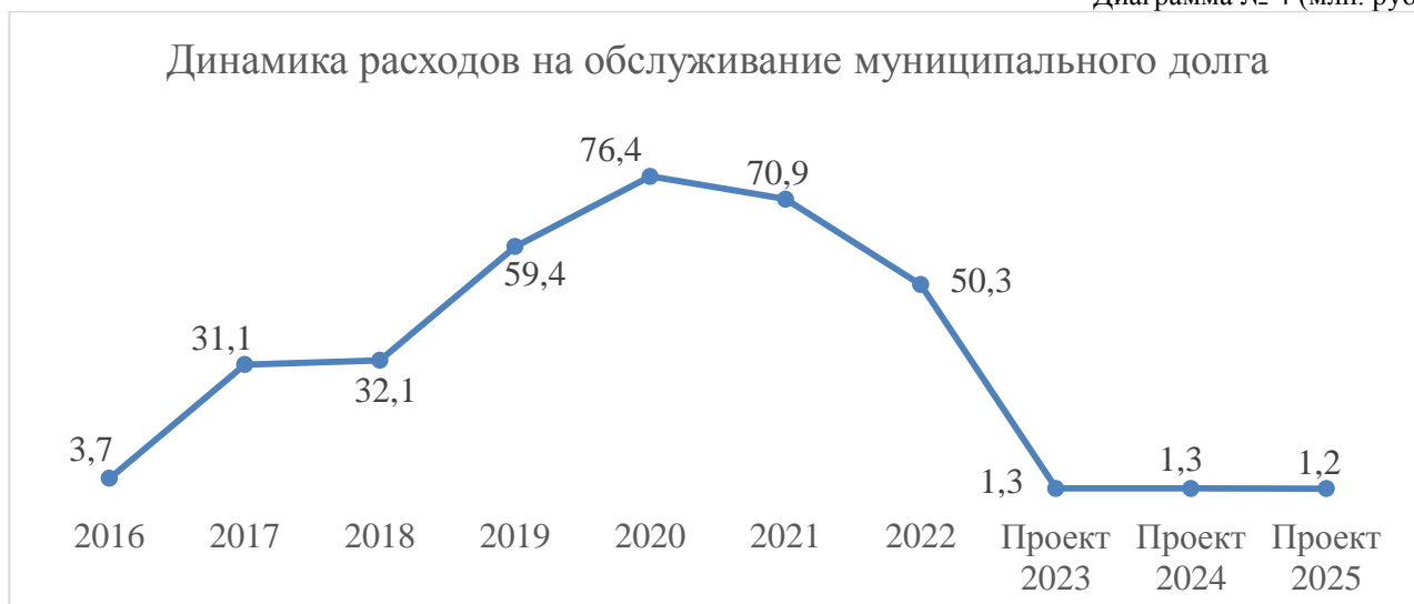
Диаграмма № 4 (млн. руб.)

Объемы расходов на обслуживание муниципального долга АГО планируются в 2023 году в сумме 1 272,5 тыс. руб. (0,03%), в 2024 году - 1 269,2 тыс. руб. (0,03%), в 2025 году - 1 243,5 тыс. руб. (0,04%), что не превышает предельную норму, установленную статьей 111 Бюджетного кодекса Российской Федерации в размере 15% объема расходов местного бюджета, за исключением объема расходов, осуществляемых за счет субвенций, предоставляемых из бюджетов бюджетной системы Российской Федерации.