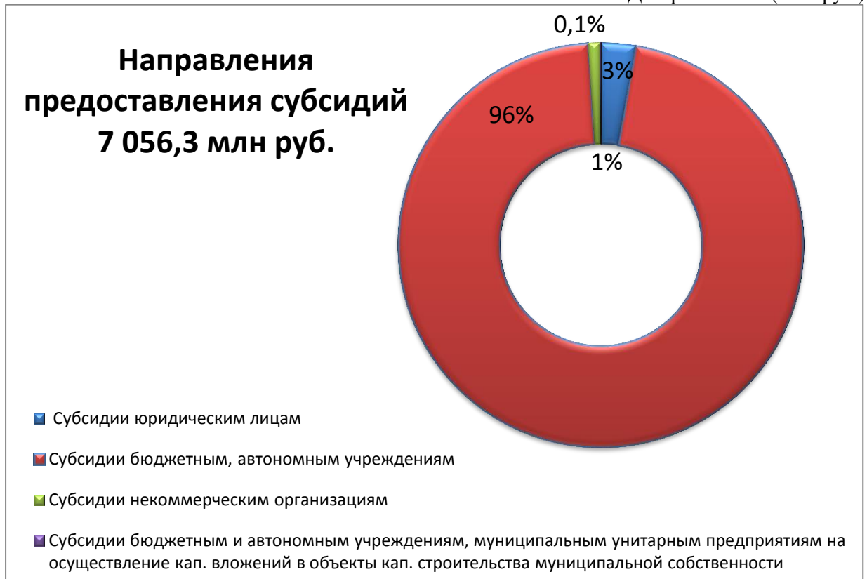
Диаграмма № 1 (млн. руб.)

В общем объеме предоставленных в 2023 году субсидий наибольший удельный вес в размере 96% или 6 789,9 млн. руб. сложился по субсидиям бюджетным и автономным учреждениям, в том числе: