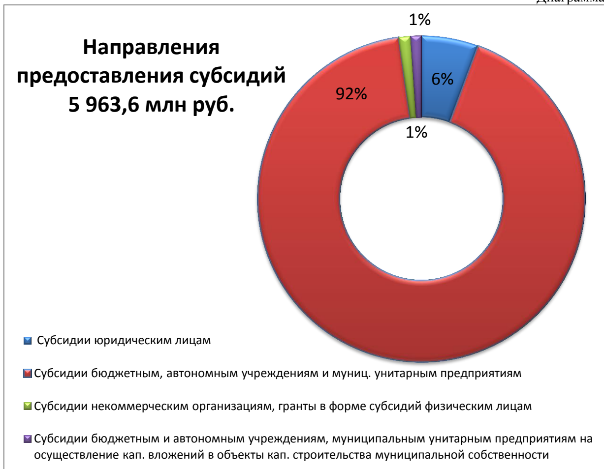
Диаграмма № 1

Сведения об удельном весе отдельных направлений предоставления субсидий в 2022 году отражены в диаграмме № 1 .